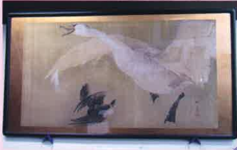
としましていうん 豊島停雲作「白鳥」(村上小学校)