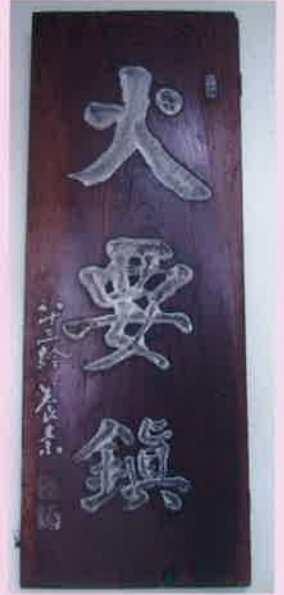
しんどうなおあつ ひのようじん 進藤直温書「火要鎮」(村上小学校)